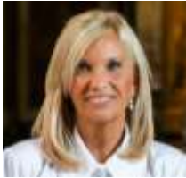
SRA. BEATRIZ ARGIMÓN (URUGUAY) (OCTUBRE 2024)