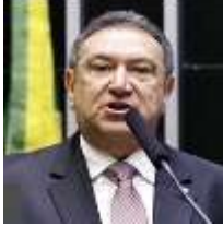
PRIMER VICEPRESIDENTE EN EJERCICIO DE LA PRESIDENCIA: DIP. ATILA LINS (BRASIL) (NOVIEMBRE 2021 - OCTUBRE 2023)