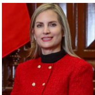
SRA. MARÍA DEL CARMEN ALVA PRIETO (PERÚ) (OCTUBRE 2028)