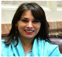
SEGUNDA VICEPRESIDENTA: SRA. LUCILA CREXELL (ARGENTINA) (OCTUBRE 2023 - OCTUBRE 2025)