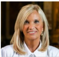
SRA. BEATRIZ ARGIMÓN (URUGUAY) (OCTUBRE 2024)