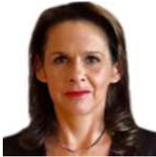
SEGUNDA VICEPRESIDENTA: DIP. SOFÍA CARVAJAL (MÉXICO) (NOVIEMBRE 2021 - NOVIEMBRE 2023)