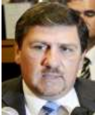
PRESIDENTE: SEN. BLAS LLANO (PARAGUAY) (NOVIEMBRE 2021 - NOVIEMBRE 2023)