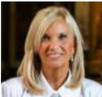
SRA. BEATRIZ ARGIMÓN (URUGUAY) (OCTUBRE 2024)