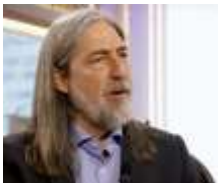
SEN. JUAN PABLO LETELIER (CHILE) (OCTUBRE 2023)