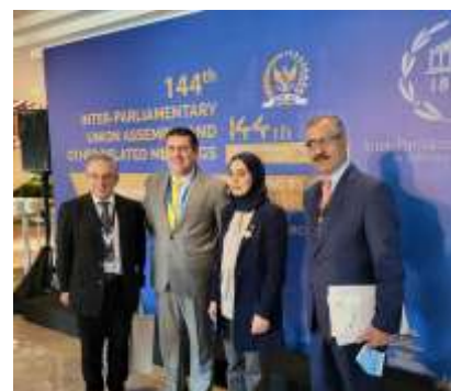
Presidente y Secretario General del Grulac junto a la Presidenta del Consejo de Representantes de Bahrein y el Secretario del Grupo Árabe