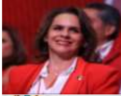
PRESIDENTA: SRA. SOFÍA CARVAJAL (MÉXICO) (OCTUBRE 2023 - OCTUBRE 2025)