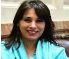
SEGUNDA VICEPRESIDENTA: SRA. LUCILA CREXELL (ARGENTINA) (OCTUBRE 2023 - OCTUBRE 2025)