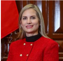
SRA. MARÍA DEL CARMEN ALVA PRIETO (PERÚ) (OCTUBRE 2028)